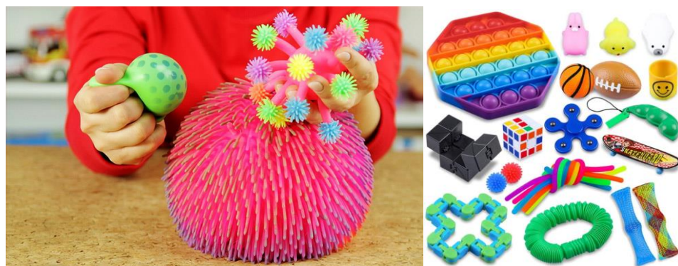
Il. 5. Przykładowe elementy wyposażenia POKOJÓW WYCISZEŃ.