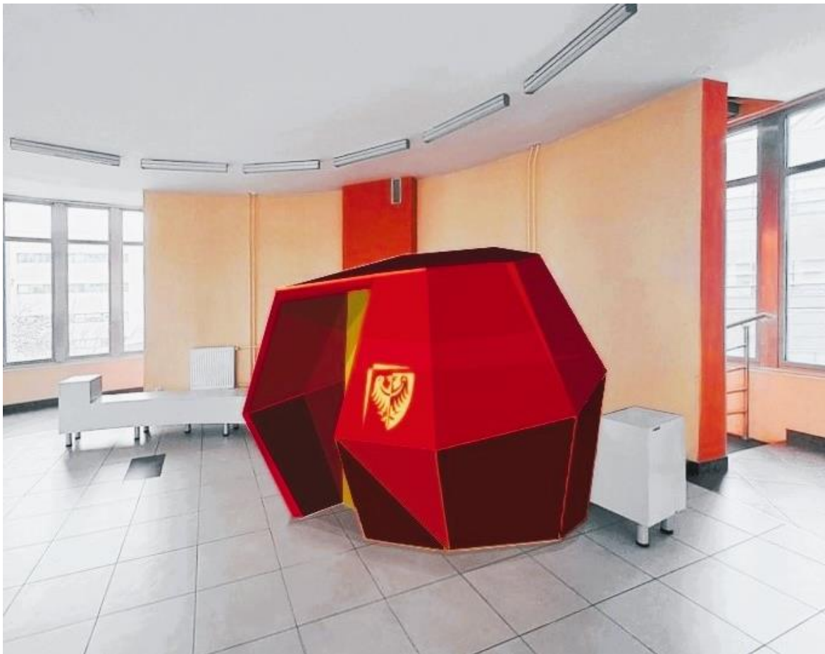
II. 4. Przykładowa forma Kapsuły Uważności.

( https://www.youtube.com/watch?v=GUCH3GZ0_Zw&t )