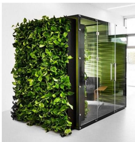
II.2. Przykłady boksów akustycznych ze strony producentów.