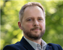
PROREKTOR DS. KSZTAŁCENIA