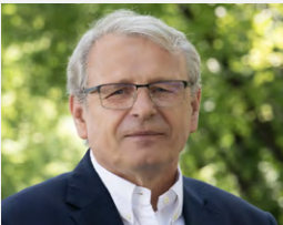
PROREKTOR DS. BADAŃ I INNOWACJI