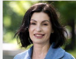
PROREKTORKA DS. ROZWOJU I INTEGRACJI WSPÓLNOTY