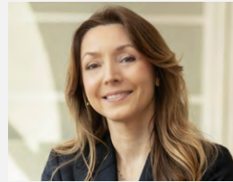
PROREKTOR DS. WSPÓŁPRACY Z OTOCZENIEM