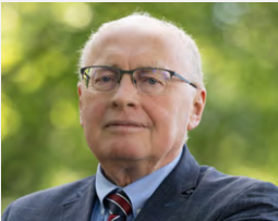
PROREKTOR DS. INFORMATYZACJI