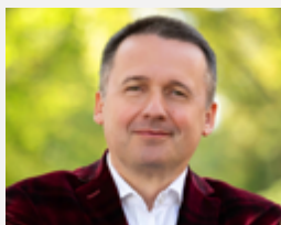
PROREKTOR DS. STUDENCKICH