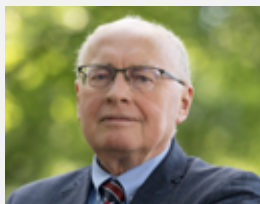
PROREKTOR DS. INFORMATYZACJI