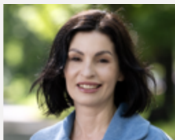
PROREKTORKA DS. ROZWOJU I INTEGRACJI WSPÓLNOTY