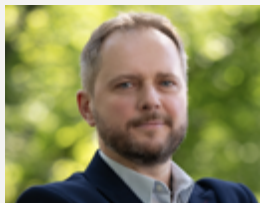
PROREKTOR DS. KSZTAŁCENIA