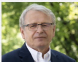
PROREKTOR DS. BADAŃ I INNOWACJI