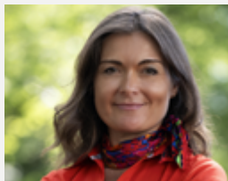
PROREKTOR DS. WSPÓŁPRACY Z OTOCZENIEM