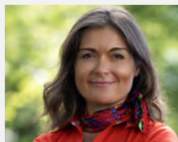
PROREKTOR DS. WSPÓŁPRACY Z OTOCZENIEM