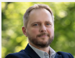
PROREKTOR DS. KSZTAŁCENIA