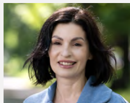
PROREKTORKA DS. ROZWOJU I INTEGRACJI WSPÓLNOTY