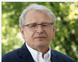
PROREKTOR DS. BADAŃ I INNOWACJI