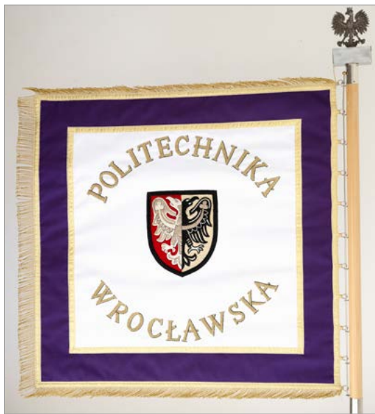
Sztandar Uczelni – pierwsza strona