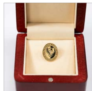
Złota Odznaka Politechniki Wroclawskiej