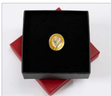
Złota Odznaka Politechniki Wroclawskiej z Brylantem