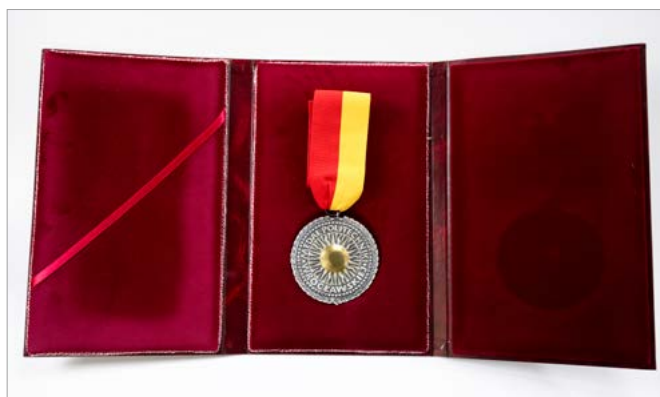
Medal za Wybitne Zasługi dla Rozwoju Politechniki Wroclawskiej