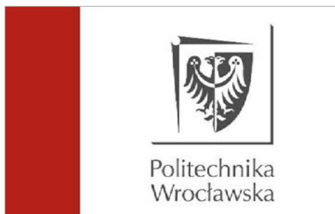
Wzór flagi Uczelni – wersja pozioma