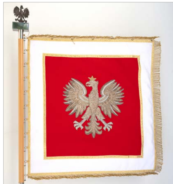
Sztandar Uczelni – druga strona