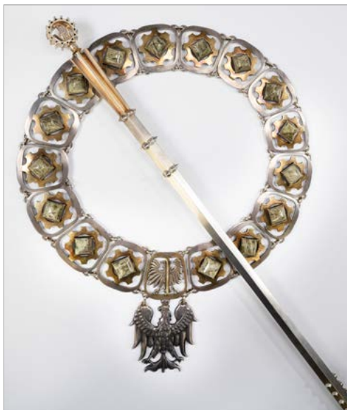
Łańcuch i berło Rektora