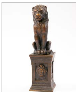
Statuetka Lew Politechniki Wroclawskiej